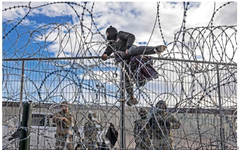
ALCANZAR EL SUEÑO. La crisis no cesa en la frontera norte, cientos de migrantes intentan cruzar a Estados Unidos sin importar el riesgo, justo en medio del proceso electoral en el que este tema se torna como central. MUNDO P. 16