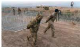
La GN de EU coloca más alambres de púas, ayer, en El Paso, Texas.

SE AVALARON los 21 puntos del pliego petitorio y 4 beneficios más, afirma; acusa a líderes paristas de acoso y extorsión; los llama delincuentes, mercenarios... pág. 13