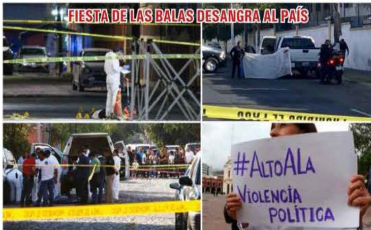
En gran parte de la geografía nacional se ha desatado la violencia política como consecuencia de la elevada criminalidad. Hasta el momento han matado al menos a 53 políticos y candidatos

Por Redacción / El Independiente ▶ 10-13