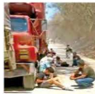
Videos difundidos en redes sociales mostraron a civiles que se resguardan de la balacera y un incendio.

Pobladores aseguraron que un grupo de 40 personas que esperaba el chalán para cruzar la presa La Angostura quedó entre el fuego cruzado. Entre ellos había