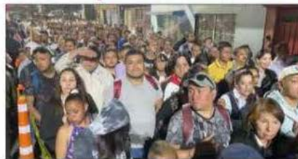
▲ La volcadura de un tráiler sobre la barda de la intersección Ocaña-Aragón provocó cierres en esa ruta. Se espera que hoy se reanude el servicio. SECCIÓN CAPITAL / P 31