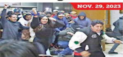
Una turba con decenas de simpatizantes de MC dio hace 3 meses “portazo” en el Congreso de NL e irrumpió en el Pleno.

que los acusados deberán permanecer en arraigo domiciliario, después de una audiencia de imputación que inició la mañana del viernes y se prolongó durante 28 horas. Fuertes allegadas al caso informaron que la Fiscalía estatal les imputó los delitos de daño en propiedad ajena doloso y equiparable a la resistencia de particulares. Entre los procesados hay candidatos de MC a puestos federales y personas que se registraron para competir por cargos locales.