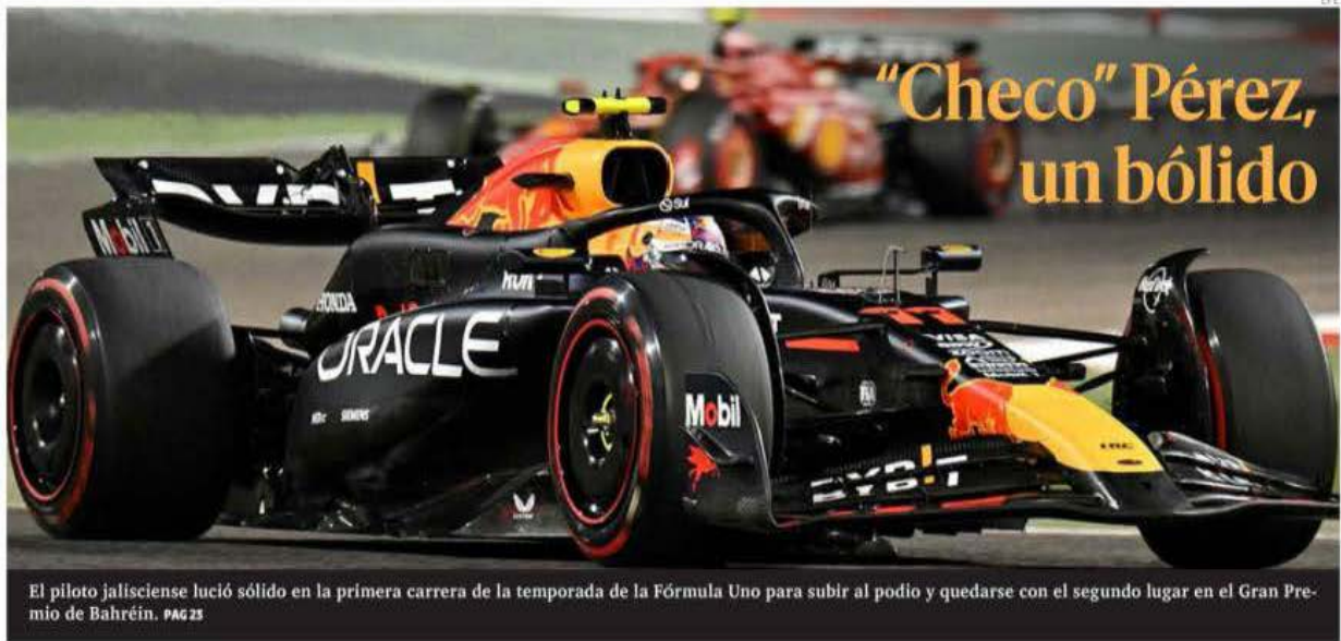
El piloto jalisciense lució sólido en la primera carrera de la temporada de la Fórmula Uno para subir al podio y quedarse con el segundo lugar en el Gran Premio de Bahrein. PAG 23

PRESIDENTE DEL CONSEJO DE ADMINISTRACIÓN: JORGE KAHWAGI GASTINE // DIRECTOR GENERAL: RAFAEL GARCÍA GARZA // AÑO 27. N.º 9.895 310.00 // DOMINGO 3 MARZO 2024 // WWW.CRONICA.COM.MX