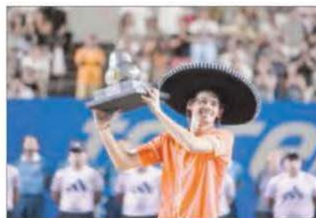
▲ El australiano se impuso al noruego Casper Ruud.