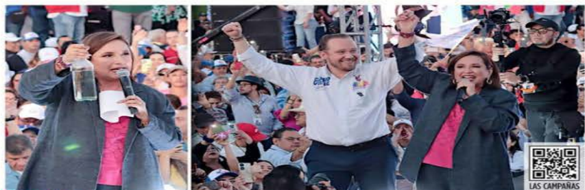
CAMPAÑA EN CDMX. Taboada acompañó a Gálvez en su mitin en el Parque Bicentenario. La candidata presidencial mostró una botella de agua distribuida por pipas de la CDMX y retó a Sheinbaum a echarse un trago de ese líquido.