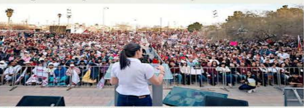
Sheinbaum tuvo, en Ciudad Juárez, su segundo mitin de la campaña electoral.

CIUDAD JUÁREZ.- Los militares seguirán apoyando en tareas de seguridad hasta que sea necesario, dijo ayer Claudia Sheinbaum, candidata presidencial de la coalición Sigamos Haciendo Historia.