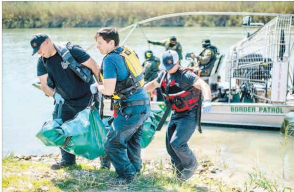
▲ Personal del Departamento de Bomberos de Eagle Pass, Texas, recobró el pasado viernes el cuerpo de una persona que al parecer murió al tratar de cruzar el río Bravo. Esa corporación ha reportado et