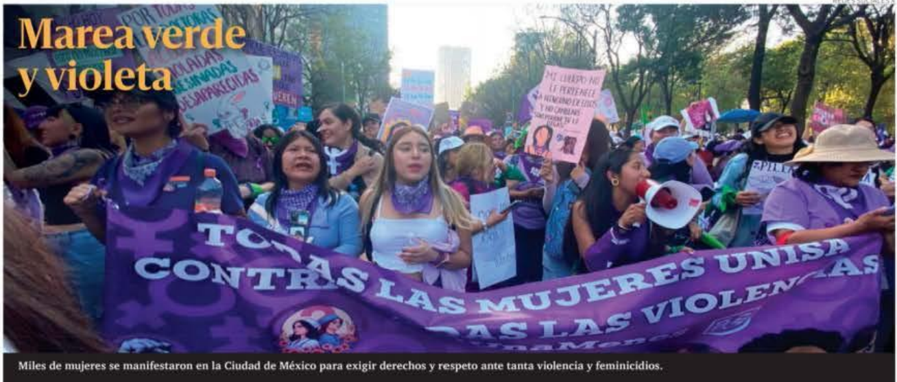
Miles de mujeres se manifestaron en la Ciudad de México para exigir derechos y respeto ante tanta violencia y feminicidios.

PRESIDENTE DEL CONSEJO DE ADMINISTRACIÓN: JORGE KAHWAGI GASTINE // DIRECTOR GENERAL: RAFAEL GARCÍA GARZA // AÑO 27 N.º 9,902 $10.00 // SÁBADO 9 MARZO 2024 // WWW.CRÓNICA.COM.MX