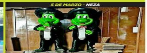
5 DE MARZO - NEZA