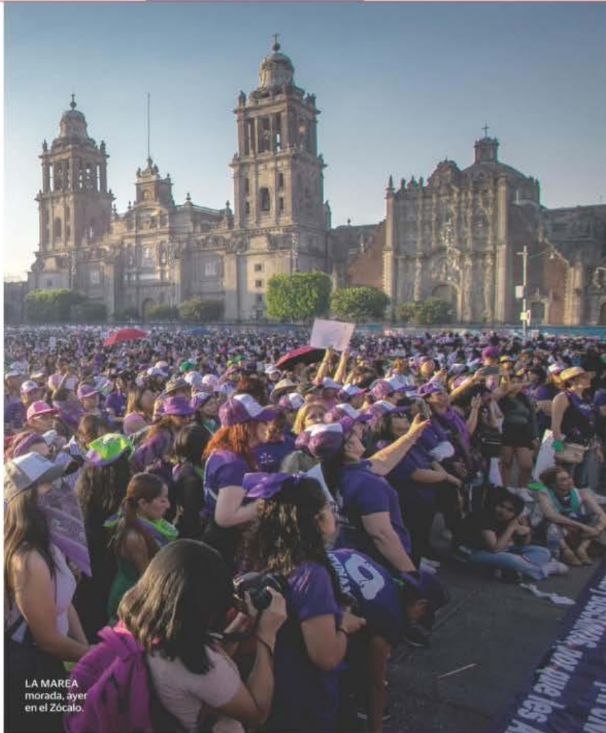
LA MAREA morada, ayer en el Zócalo.

Declaran culpable de narcotráfico a expresidente de Honduras pág. 16