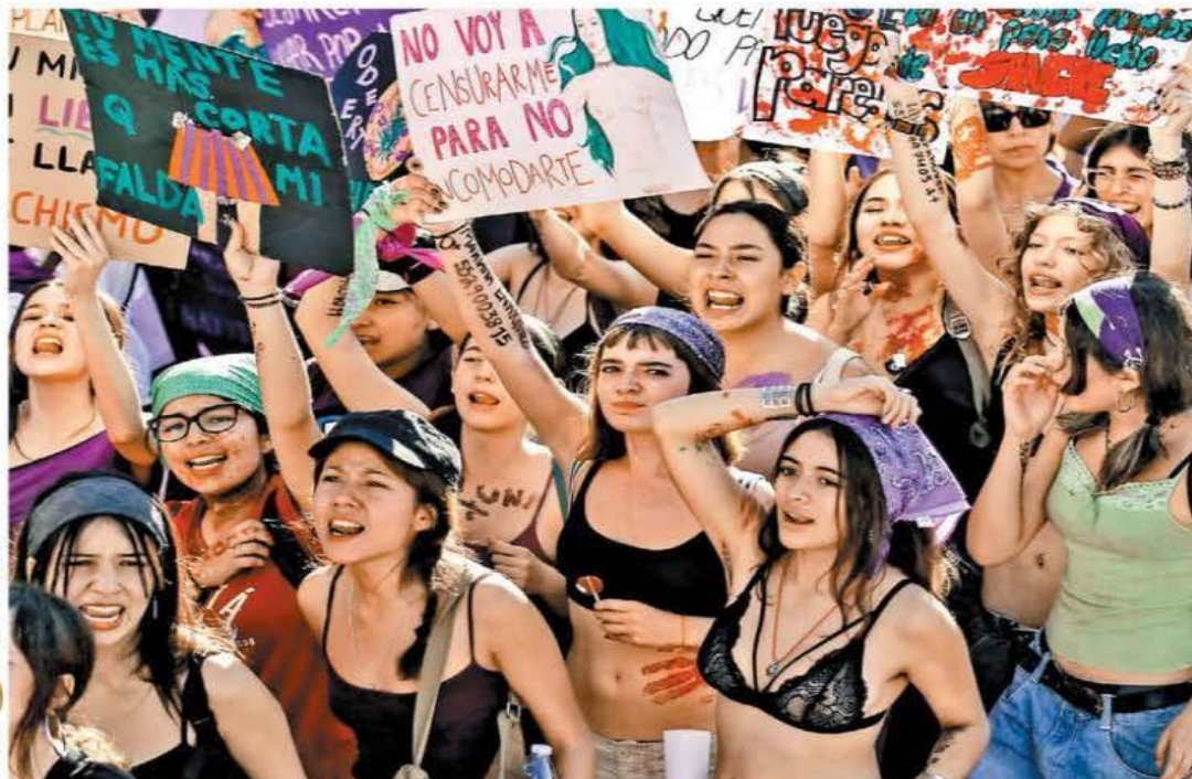
La multitud recorrió Paseo de la Reforma rumbo al Zócalo, donde hubo consignas, sororidad y fogatas.