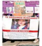
La familia de la joven se sumó ayer al 8M.