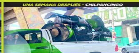
UNA SEMANA DESPUÉS - CHILPANCIÑO