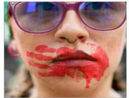
▲ Un torrente violeta inundó ayer la capital del país con una marcha masiva, festiva, creativa y política, marcada por la ira, la tristeza y la exigencia de justicia por quienes no están. La movilización fue la