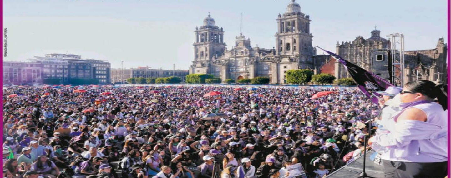
La Plaza de la Constitución lució a reventar. Miles de mujeres se arrojaron entre sí, tras compartir no sólo consignas y carteles, también sus historias de dolor, consecuencia de la violencia machista.

ALEJHÍ SALGADO, YALINA RUIZ Y SHARON MERCADO —nacion@eluniversal.com.mx