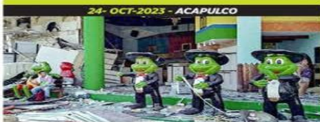
24-OCT-2023 - ACAPULCO