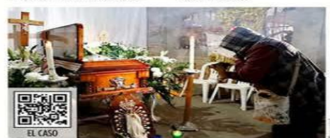
La madre vela a su hijo.

"Estuvo en el plantón (afuera de Palacio Nacional en Ciudad de México) sufriendo hambre, frío, en solidaridad con los padres y madres de los 43 jóvenes desaparecidos que no conocí", dijo en la homilía el padre Filiberto.