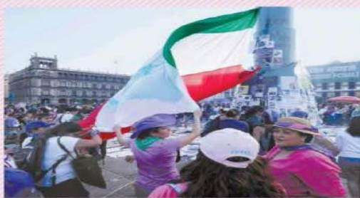
Un grupo de feministas colocó en el Zócalo una bandera tricolor gigante, que costieron y a la que le escribieron frases y un símbolo de Venus.