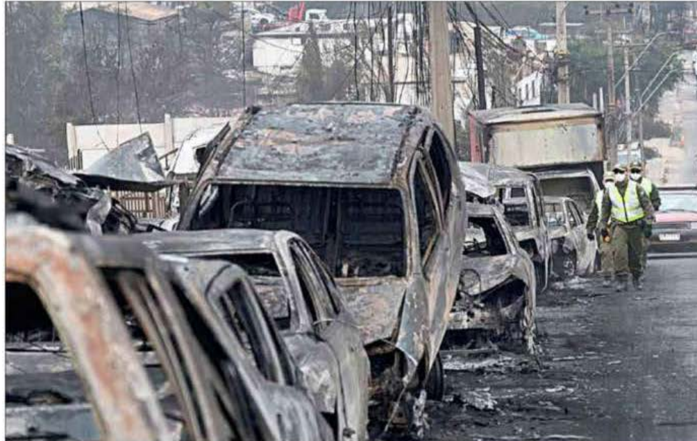
▲ Cientos de personas desaparecidas y 15 mil viviendas arrasadas en la región de Valparaíso es el saldo del tercer día de los siniestros forestales más mortíferos en la historia reciente del país andino. En la ciudad de Villa del Mar, una de las más castigadas, al igual que Quilpué