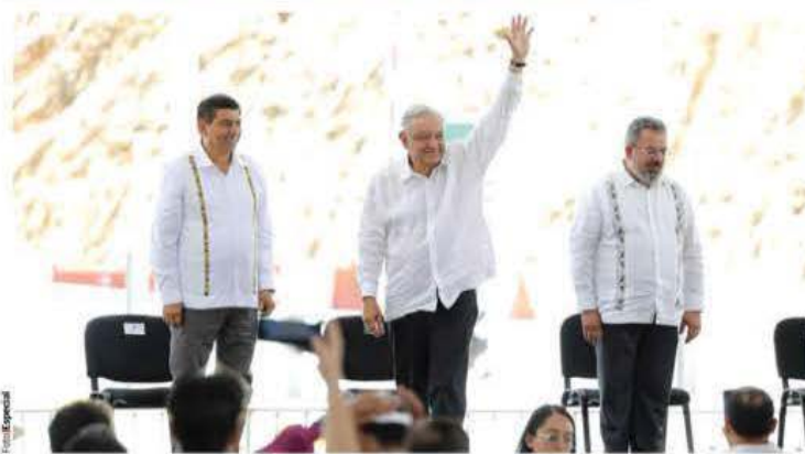
AMLO, flanqueado por Salomón Jara (izq.) y Jorge Nuño, ayer en la inauguración de la autopista de 104 km.

PRESIDENTE abre vía Barranca Larga-Ventanilla que une a la capital con Puerto Escondido; destaca titular de SICT, Jorge Nuño, esfuerzos titánicos para concluir el portentoso ingenieril; el gobernador Salomón Jara afirma que la obra es un sueño que se consolida en la 4T. pág. 10