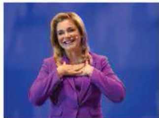
MARU CAMPOS, gobernadora de Chihuahua.

ES EL PRIMER presidente del país con dos periodos de gobierno consecutivos; presume apoyo de más de 85%; su popularidad, basada en mano dura contra pandillas. pág. 20