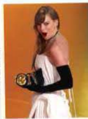
TAYLOR Swift, ayer, en la 66 entrega del Grammy.

EN MENSAJE por su Segundo Informe de Gobierno la gobernadora de Chihuahua afirma que en su entidad hay Estado de derecho. pág. 13