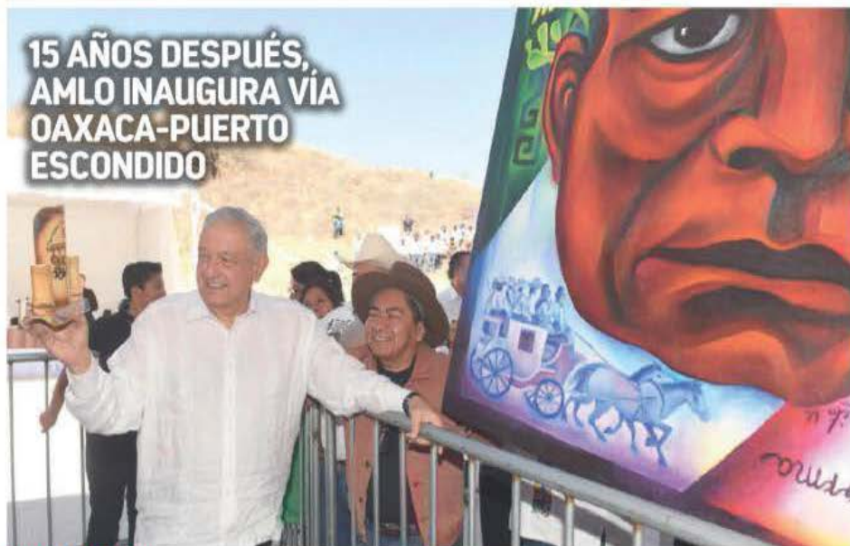
POR FIN, LA VÍA RÁPIDA. Proyectada con el entonces panista Felipe Calderón y abandonada en ese gobierno y en el del priísta Enrique Peña Nieto, ayer por fin el presidente Andrés Manuel López Obrador inauguró la carretera Barranca Larga-Ventanilla en Oaxaca. Conectará la capital oaxaqueña con la costa del Pacífico en 2 horas y media y ya no en las 6 horas y media que se requería. Pág. 5