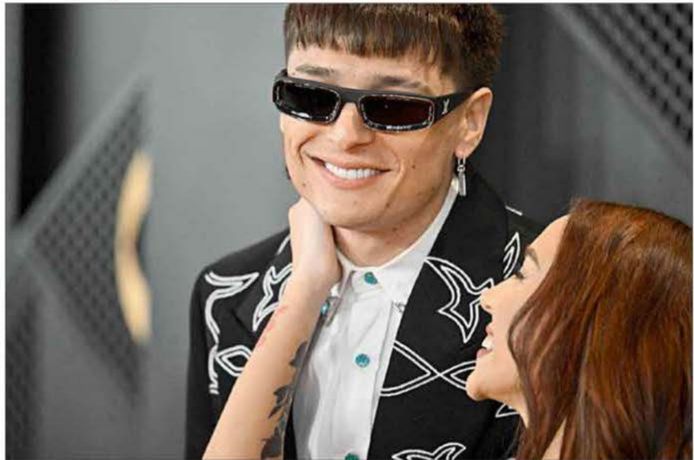
▲ Con Génesis , el polémico cantante ganó su primer gramófono por mejor álbum de música mexicana. Taylor Swift brilló en el encuentro en la Crypto.com Arena al convertirse en la primera artista en obtener