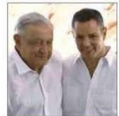
El ex gobernador Alejandro Murat fue invitado por el Presidente a la apertura de la vía.