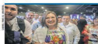
XÓCHITL: "CONTINUARÁ EL TREN MAYA" NACIÓN | A8