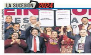
LA SUCESIÓN 2024 "LA DERECHA, SIN PROYECTO": CLAUDIA NACIÓN | A8

Datos de Pemex obtenidos por EL UNIVERSAL revelan que la mayor cantidad de huachicol se concentra en Tlalpan y Azcapotzalco, que acumulan 73% de las tomas, con un total de 124. | METROPOLI | A20