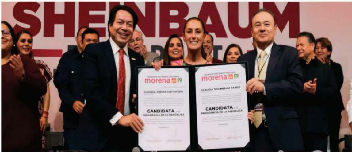
Claudia Sheinbaum muestra la constancia como candidata única a la Presidencia de la República, por la coalición Sigamos Haciendo Historia. Se la entregaron el presidente del Consejo Nacional de Morena, Alfonso Durazo Montaño, y el presidente Nacional del partido, Mario Delgado.