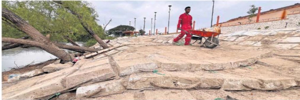
El malecón Carlos A. Madrazo de Villahermosa, Tabasco, se empezó a reconstruir en 2022 y, aunque todavía no ha sido terminado, ya presenta deficiencias.

Malecón de 1,500 mdp sin inaugurar ya necesita reparaciones