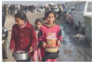
Menores palestinos en campos de refugiados. Pág. 15

25,000 muertes ha causado Israel en la Franja 8 de cada 10 víctimas fatales en la Franja de Gaza son mujeres y niños, según autoridades palestinas