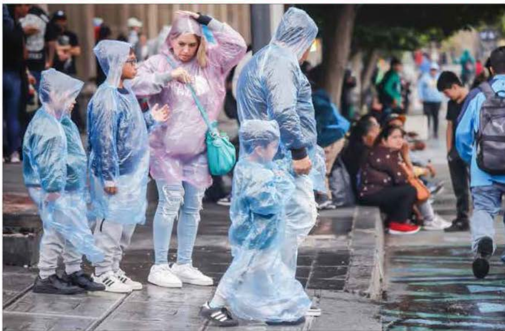
▲ El temporal ocasionará caída de nieve o aguanieve en las sierras de Baja California, Sonora, Chihuahua y Durango, donde prevén temperaturas de hasta menos 10 grados, informó el Servicio