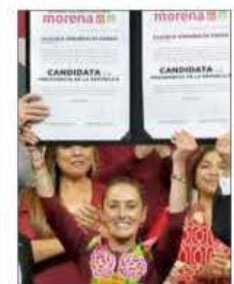
La ex gobernante muestra la constancia como candidata morenista.