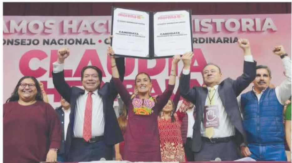
PROTESTA COMO CANDIDATA DE MORENA. La exjefa de Gobierno de la CDMX, Claudia Sheinbaum, se comprometió a llevar a México "por el sendero de la paz, la seguridad, de la democracia, de las libertades y la justicia". Y señaló: "La democracia no es un arma de la derecha, es un arma nuestra".

Con voto unánime, Sheinbaum recibe la constancia que la acredita como candidata de Morena