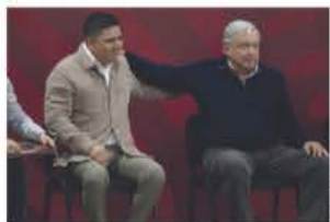
VISITA. El presidente acompañado del gobernador de SLP Ricardo Gallardo Cardona. P. 6