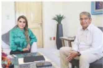
LA GOBERNADORA del estado y el Fiscal general, durante la reunión, ayer.

ADVIERTEN en UNAM desafíos que pondrán en riesgo supervivencia; alta vulnerabilidad en zonas agrícolas; peligro de desplazamiento de personas. pág. 8