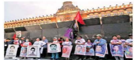
Los padres de los 43 marcharon en la CDMX y luego instalaron un plantón afuera de Palacio Nacional, cuyo exterior fue amurallado.