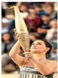
ADRENALINA / 11