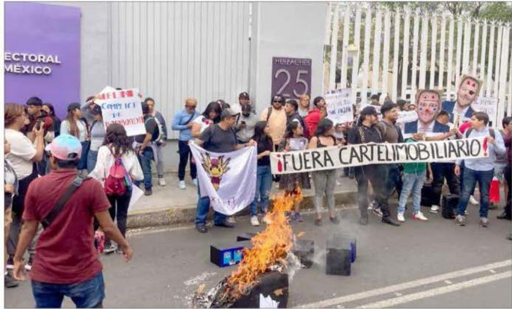
▲ Universitarios se manifestaron frente al Instituto Electoral de la Ciudad de México contra la decisión de la Comisión de Quejas del organismo que –a partir de un recurso promovido por el PAN– impuso medidas cautelares que impiden a Morena vincular al aspirante a jefe de Gobierno y ex alcalde de Benito Juárez, Santiago Taboada, con el cártel inmobiliario. Foto e información de Angel Bolaños / P 28