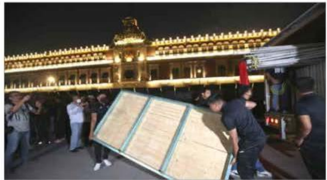
▲ Anoche, los familiares montaron el campamento.

E. OLIVARES, A. URRUTIA, J. LAURELES, C. GÓMEZ Y S. OCAMPO / P 9