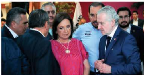
XÓCHITL, ayer con los líderes del PAN, PRI y PRD y Santiago Creel.

XÓCHITL y los líderes del PAN, PRI y PRD se reúnen 3 horas con Tadei; piden cancelar mañaneras, porque el Presidente "es incapaz de atender llamados" del árbitro, señalan; insisten en campaña sobre apatidismo de programas sociales. pág. 8