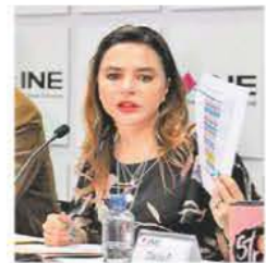
Carla Humphrey, CUARTOSCURO

Washington lanza condena SRE insta a Celac a unirse a la demanda en La Haya ÁNGEL HERNÁNDEZ · PÁGS. 4 Y 5