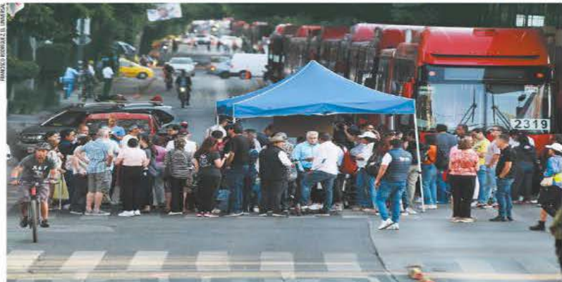
Vecinos de la alcaldía Benito Juárez bloquearon por nueve horas el cruce de la avenida Insurgentes con el Eje 4 Sur Xola, en donde montaron carpas y sillas para exigir una investigación sobre la calidad del agua que llega a sus casas y advirtieron que hoy regresarán a manifestarse. La protesta afectó la operación de la Línea 1 del Metrobús. | A20 |