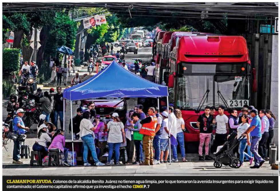
CLAMAN POR AYUDA. Colonos de la alcaldía Benito Juárez no tienen agua limpia, por lo que tomaron la avenida Insurgentes para exigir líquido no contaminado; el Gobierno capitalino afirmó que ya investiga el hecho CDMX P. 7