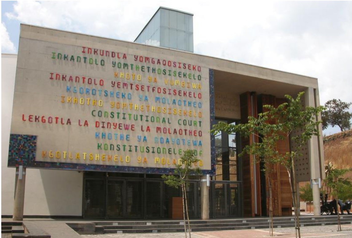
Sudáfrica, Corte Constitucional